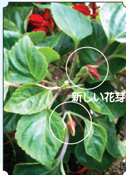
少しすると新しい 花芽がでてきます。