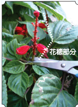
咲き終わった花穂