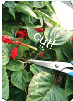
咲き終わった花穂を カットします。(手でも折れます)