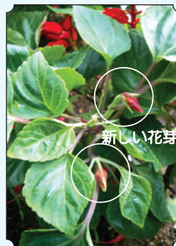
少しすると新しい花芽がでできます。