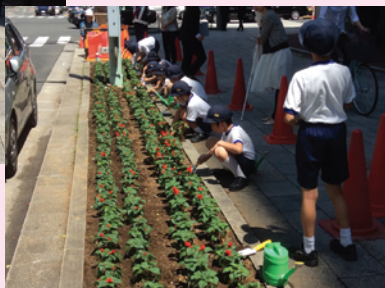
みんなと一緒に花植えをがんばりました！