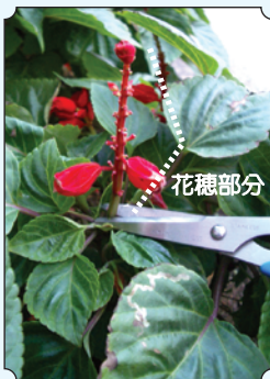
咲き終わった花穂