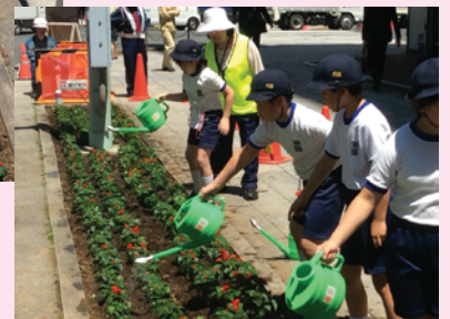
お水をしっかり、たっぷり撒いて終了です！