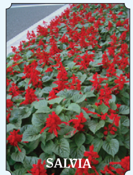
定期的にかットするときれいに咲き続けます。