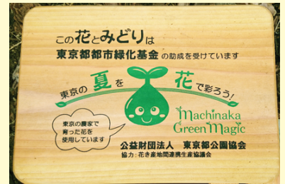
東京都公園協会設置看板