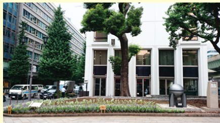
現在の花壇には“アンゲロニア・ハツユキソウ・ピンカ・メランポジウム”が植えられています。