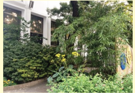
生い茂りうっそうとした様子