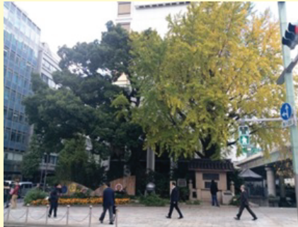
花の広場全体の様子