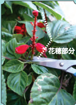
咲き終わった花穂