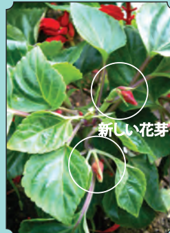
少しすると新しい花芽がでできます。