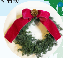
※こちらはイメージです